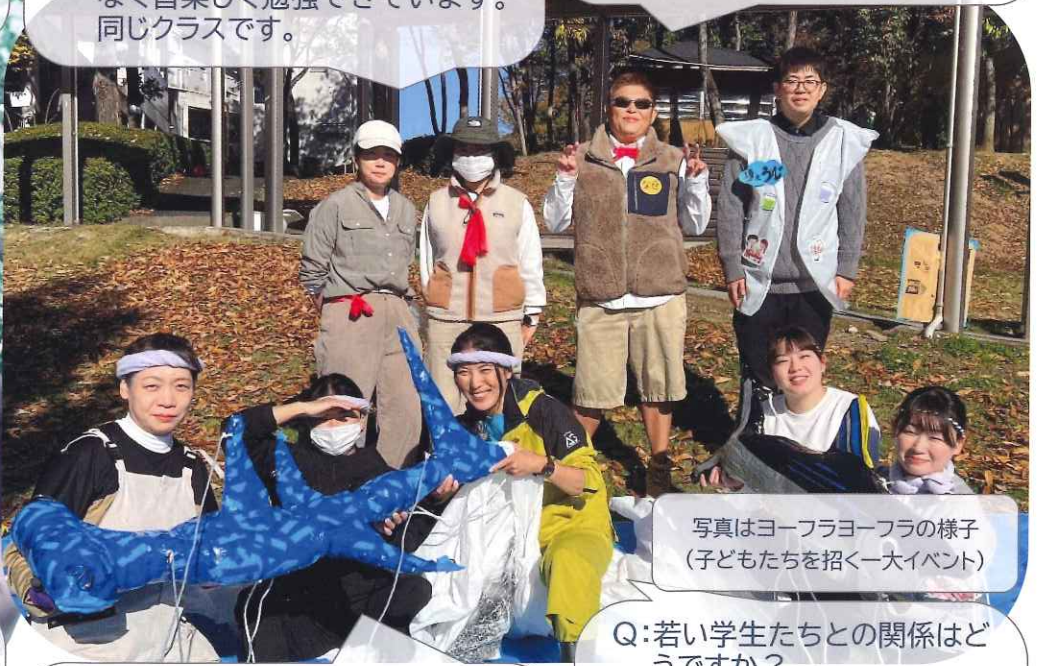
写真はヨーフラヨーフラの様子 (子どもたちを招く一大イベント)